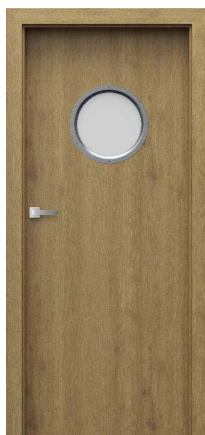
model 1.1 z bulajem