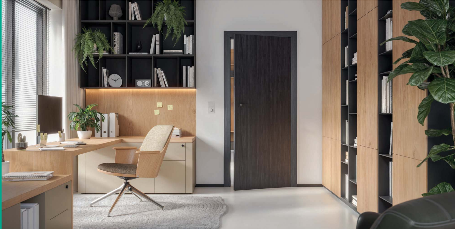
PORTA CPL 1.1, Struktura Ciemny, klamka ELEGANTO czarny