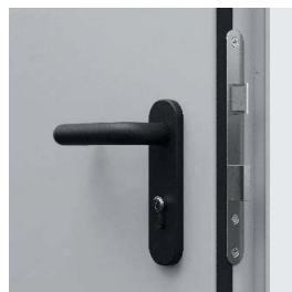
zamek zapadkowy pod wkładkę patentową, klamka w komplecie