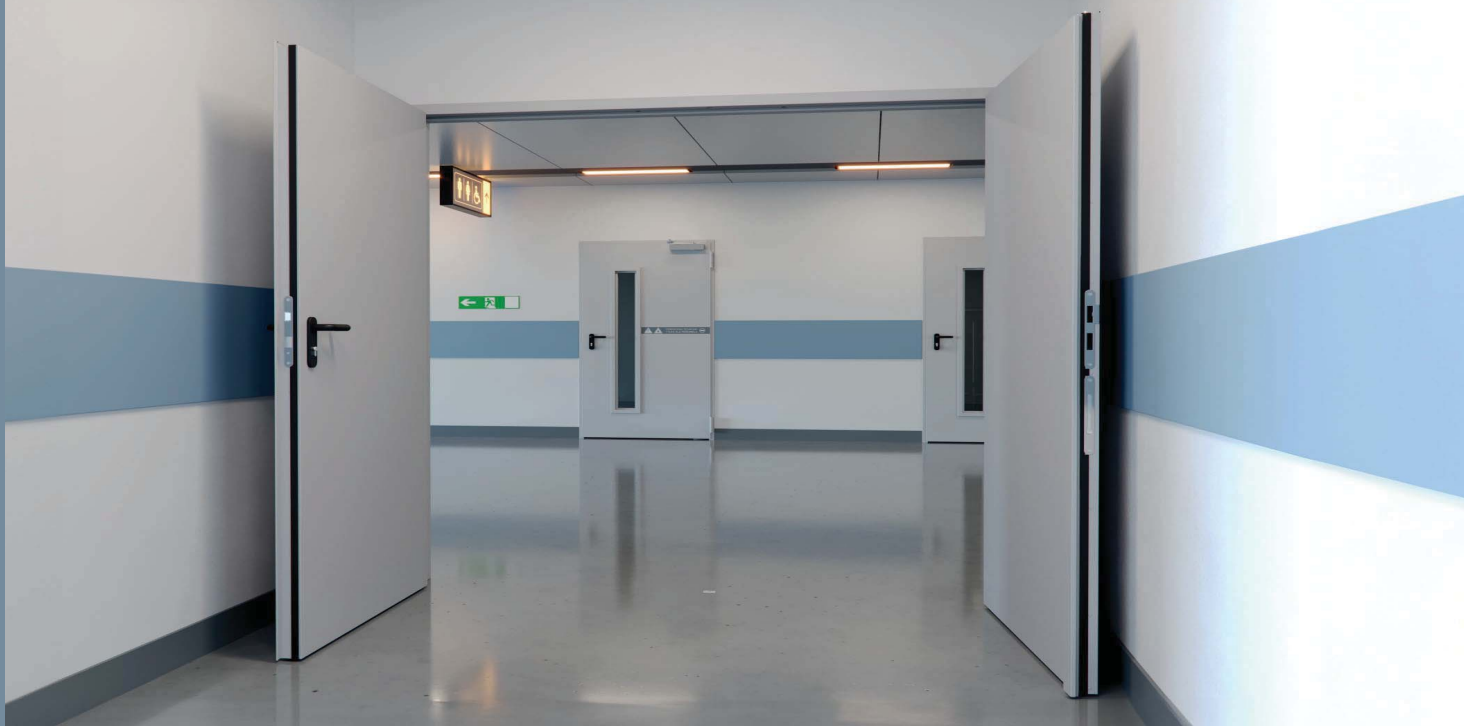
Steel EI 30 PLUS, podwójne model pełne, pojedyncze model 3, Popielaty MAT