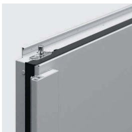
rygiel zamka góra / dół