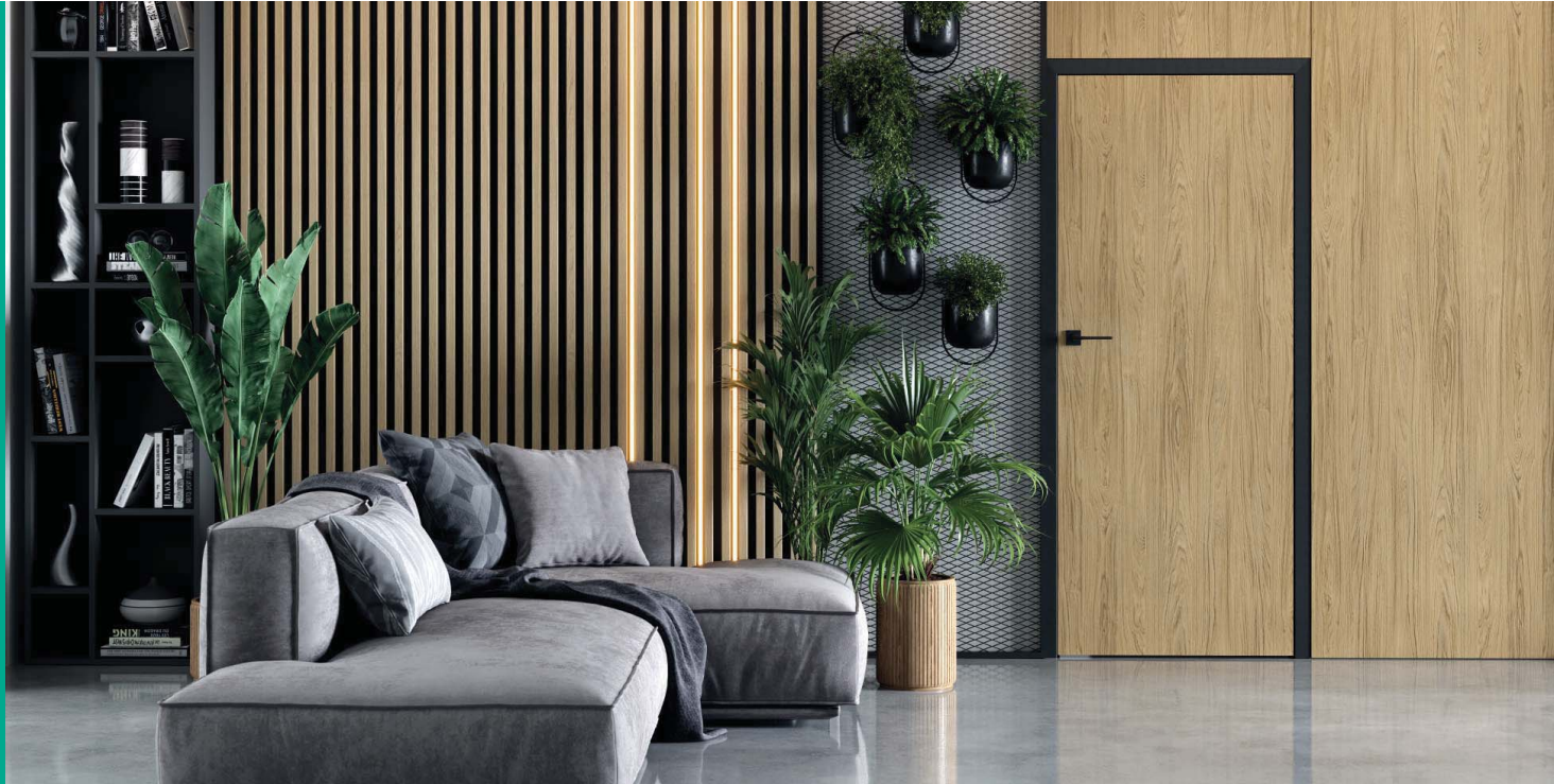
PORTA RESIST 1.1, Dąb Casella Naturalny, klamka LAGO czarna