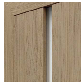
przeszklenie w modelu 4.A dostępna również szyba czarna - opcja za dopłatą