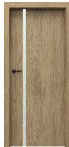
model 4.A dostępna również czarna szyba