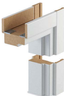
100 mm, okleina syntetyczna (łączenie listew prostych pod kątem 90°)