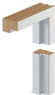
60 mm, wersja podstawowa (bez listew maskujących)