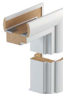
100 mm, okleina syntetyczna (z listwami maskującymi zaokrąglonymi)